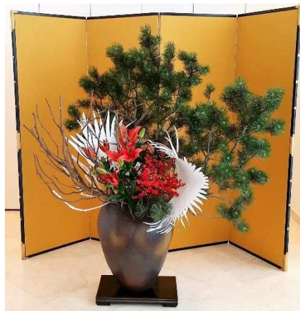
Ikebana zum feierlichen Anlass